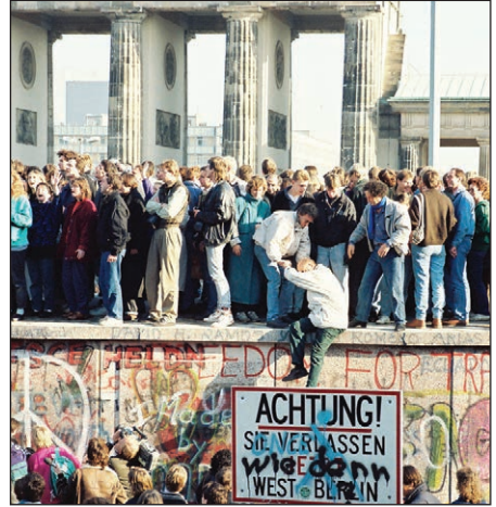
Geata Brandenburg le titim fhalla Bheirlín