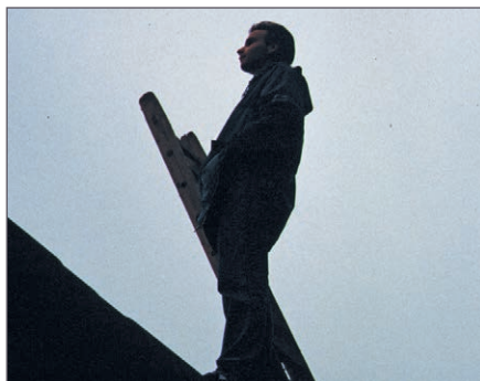
Titim fhalla Bheirlín

Is mar sin é don té a théann i mbun athchuidhne.