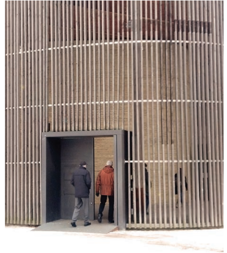
Séipéal an Athmhuintearais, Beirlín

A Dhia an ghill, glaonn tú sinn isteach i gcúnant, a thugann sinn le chéile mar aonad grámhar. Agus de d’ainneoin, tógaimid fallaí móra a scaranna ó chéile sinn.