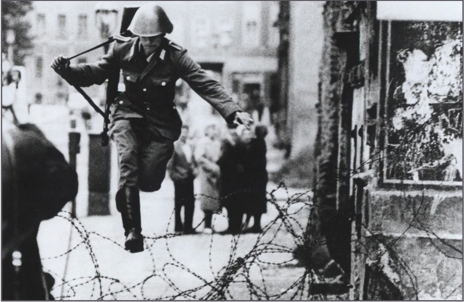
Póilín na Gearmáine Thoir a d'iompaigh