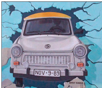
Saothair ealaíne ar fhalla Bheirlín

An mbeadh sé i gceist, go bhfuil beag is fiú déanta againn dinn féin, go dtí an pointe, gur réadúla an saol, tríd an scáileán ná mar a bhíonn tríd an tadhall. An mbeadh sé i gceist, go bhfuil súil chomh gear anois orainn, gur soiléire a fheicimid an diacht féin trínár ndaonnacht, ach mionathrú seismeach a chur i bhfeidhm?