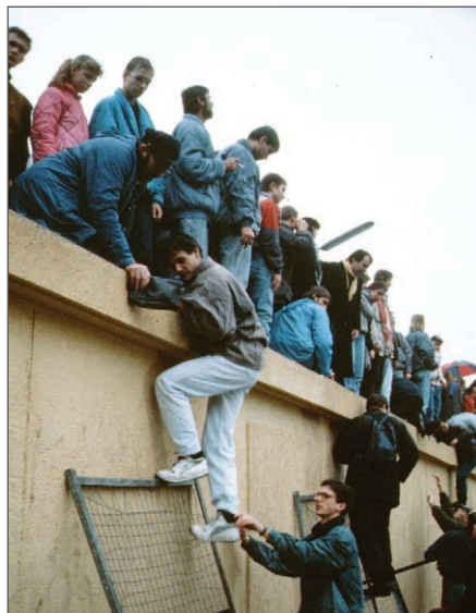
Titim fhalla Bheirlín

Is sin í an uair go bhféadfaidh mé mé féin a scaoileadh isteach i réaltra an ‘táim’.