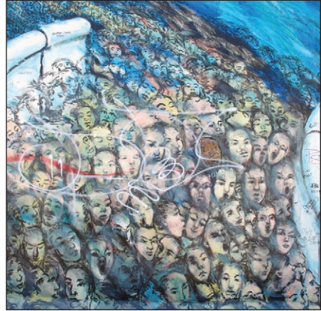
Saothair ealaíne ar fhallaBheirlí