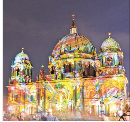
Ardeaglais Bheirlín, i rith fhéile an tsolais

Íosa Críost, a bhúí leis an mbás is ea a bhain do chorp cráite céasta suaimhneas amach. Agus fós, d'éirigh tú ó mhairbh ar Domhnach Cásca.